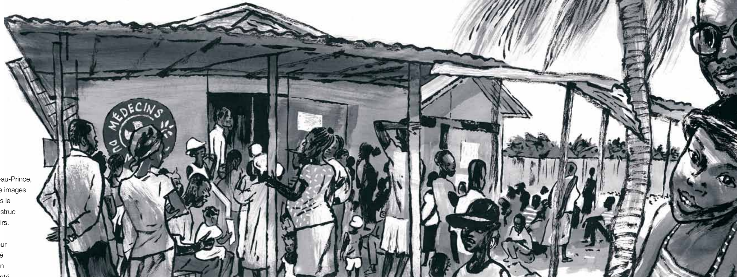
File d'attente à l'hôpital de Cité Soleil

Car en Haïti les solutions temporaires, prises pour faire face à l'urgence de la situation et aux nouvelles urgences qui se succèdent, deviennent malheureusement durables... voire définitives. C'est là tout le dilemme. Les Haïtiens l'ont eux bien compris et ne se font aucune illusion. « La reconstruction n'avance pas assez » nous répètent-ils. Ils savent mieux que d'autres qu'il n'appartient pas à des ONG de reconstruire leur pays. Sans plan