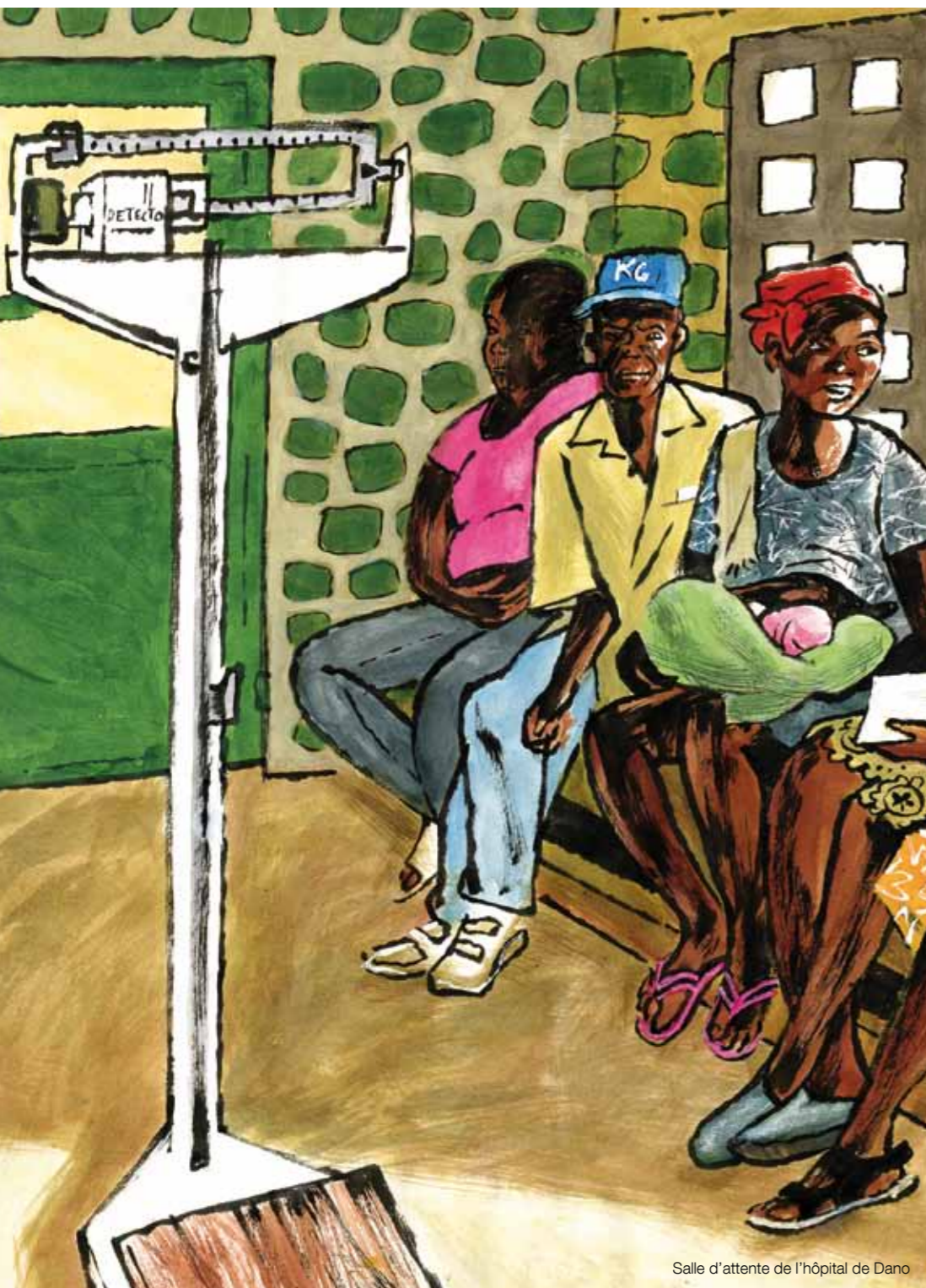
Salle d'attente de l'hôpital de Dano